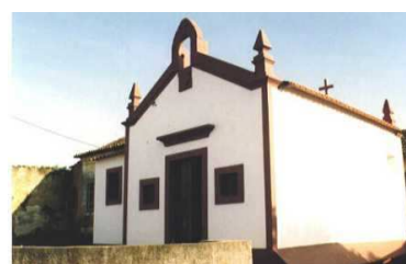
Capela de Santa Luzia