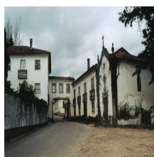
Casa Solar da Quinta de Aguieira

Macinhata do Vouga oferece o Solar da Quinta de Serém, as Capelas de Nossa Senhora da Paz, no Beco, de Santo Antão, em Soutelo, e da Nossa Senhora da Aflição, situada em Jafafe e a Igreja de Macinhata.