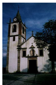
Igreja da Trofa

Na freguesia de Lamas do Vouga a Estação Arqueológica de Cabeço do Vouga/Castelium Marnelis e a Ponte de Cabeço do Vouga , também conhecida por Ponte Velha do Marnel, são dois ex-libris .