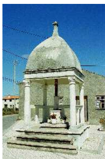
Cruzeiro da Trofa

Na Freguesia da Trofa não será nunca de mais falar da Igreja Matriz da Trofa , de data anterior ao séc. XVI, que alberga o Panteão dos Lemos (monumento nacional), do Pelourinho do séc. XVI , do Cruzeiro na parte posterior da Igreja, da Capela de S. Sebastião com escultura do séc. XVI, da Capela de S. Inácio , em Mourisca do Vouga e de um Pelourinho do 2º quartel do séc. XVI , no largo para Crastovães.