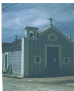
Igreja de São Caetano